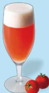
トマト酒 × ホッピー