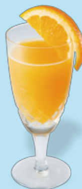
オレンジジュース × ホッピー