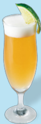
ジン × ホッピー

フレーバーを加えたり、フルーツを組み合わせた り、ホッピーでおいしい味のバリエーション をお楽しみください。