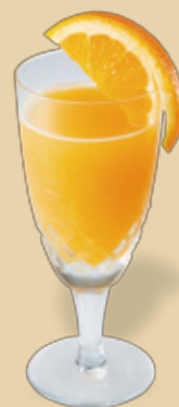
オレンジジュース × ホッピー