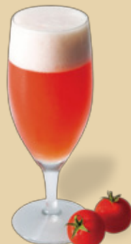
トマト酒 × ホッピー