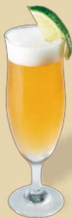
ジン × ホッピー

フレーバーを加えたり、フルーツを組み合わせた たり、ホッピーでおいしい味のバリエーション をお楽しみください。