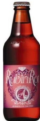
赤坂ビール ルビンロート