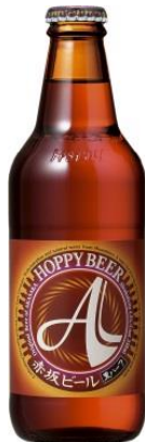
赤坂ビール ミュンヘン